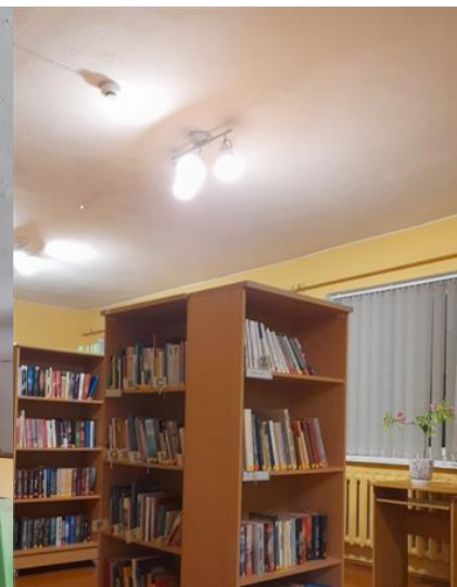
Telpu un gaismu pārmaiņas.