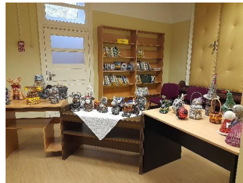
Nr. 5 Ceļojošās izstādes