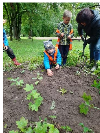
Nr.6 Pasaules talka aicina – iestādi savu “Laimis kokus”!

Kopā ar Striķu skolas pirmsskolas grupiņu