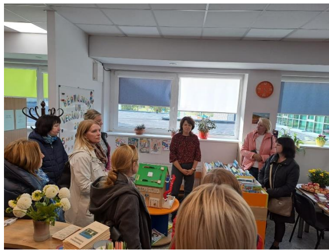
Nr.8 Saldus novadu bibliotekāru semināri, apmācības un profesionālās pieredzes brauciens.