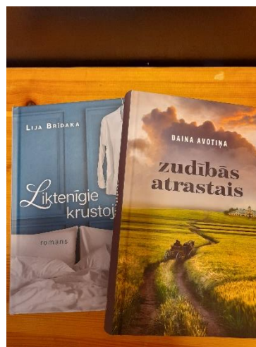
Nr.2 "Grāmatu iepirkuma programma publiskajām bibliotēkām 2022"