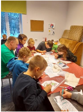
Nr. 4 Krāsu spēles