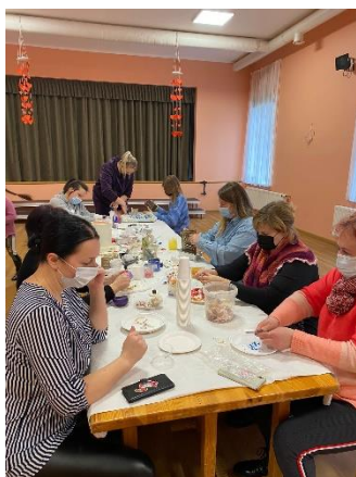
Nr. 3 Sveču liešana