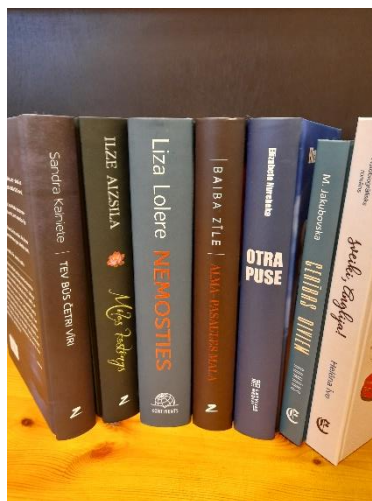
Nr.1 Jauno grāmatu izstādes bērniem un pieaugušajiem