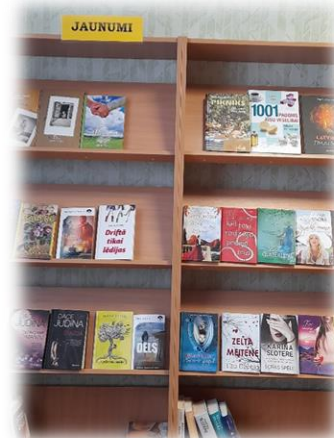
Nr.1 Jauno grāmatu izstādes bērniem un pieaugušajiem