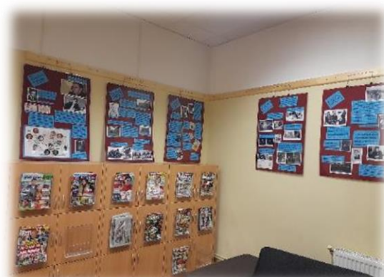
Nr. 3 Ceļojošās izstādes