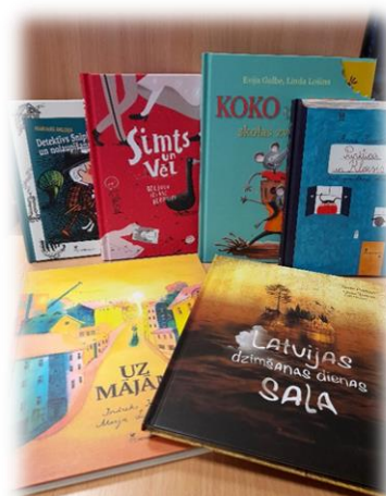
Nr.2 “Vērtīgo grāmatu iepirkuma programma publiskajām bibliotēkām”