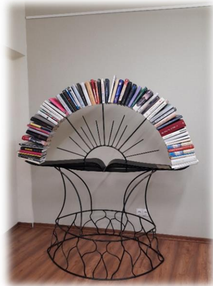
Nr.6 Saldus un Brocēnu novadu bibliotekāru profesionālās pieredzes brauciens “Mācīsimies no kaimiņiem” – Mažeīķu rajona bibliotēķu un kultūrvides iepazīšana