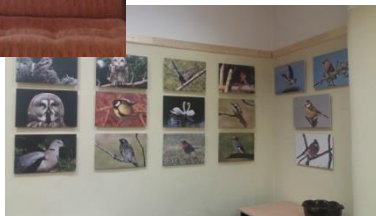
Intas Vīnšteinas fotoizstāde "Dabā.... Putnos..."