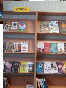
Grāmatu jaunumu izstādes