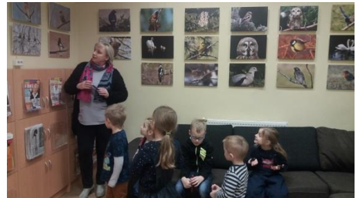
Konkurss bērniem "Uzmini putnus"

Saldus pilsētas bibliotēkas veidotās novadpētniecības izstādes