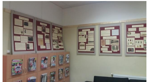
"Grāmatniecības vēsture Saldus novadā"

Saldus pilsētas bibliotēkas veidotās novadpētniecības izstādes