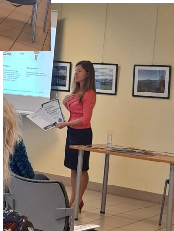
Semināri Saldus pilsētas bibliotēkā