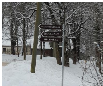
Norādes uz Bibliotēku