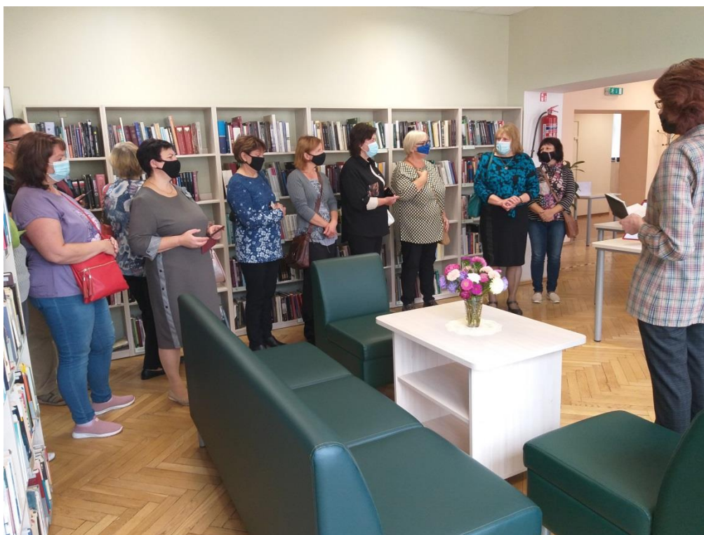
Saldus novada bibliotekāri Mažeiku bibliotēkā Lietuvā