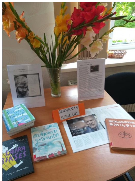
Jauniegvumi un literālā izstāde