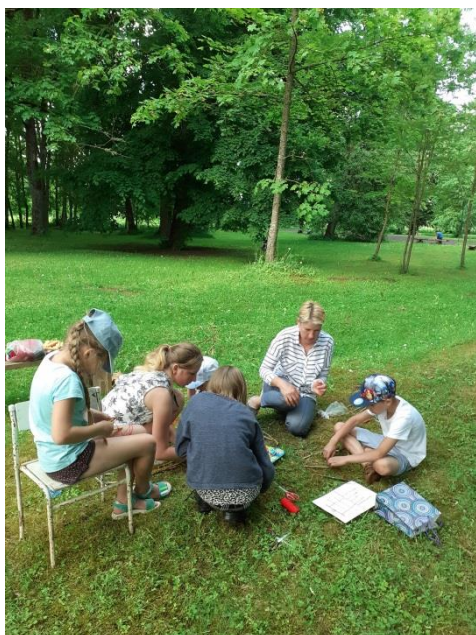
Nodarbība “Puzuri no dabas materiāliem”