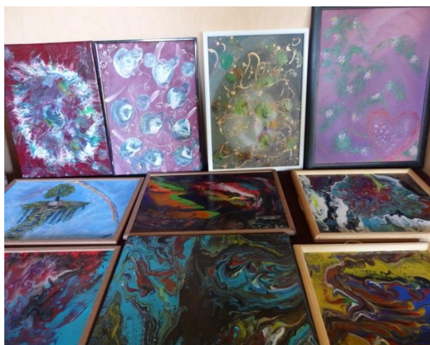
Izstāde “Pandēmijas mistērijas”