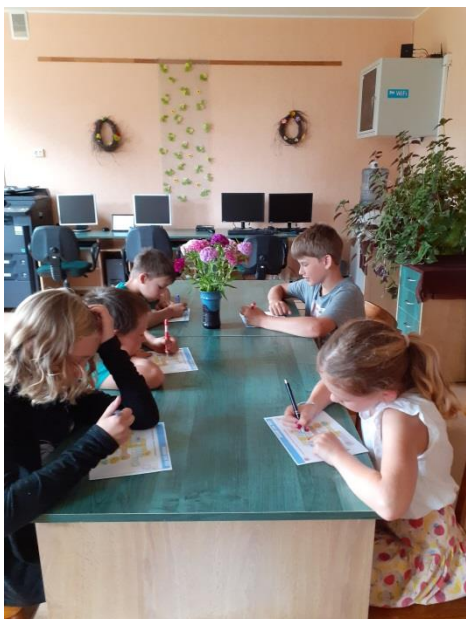
Pasākums “Asini prātu”