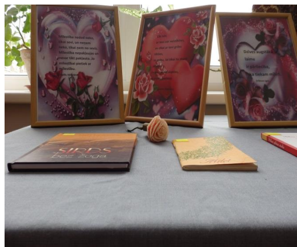
Izstāde “Pa pasauli mūžam lido mīlestība”