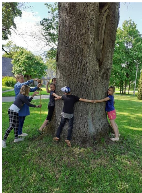
Dižkoku pētīšana pagastā