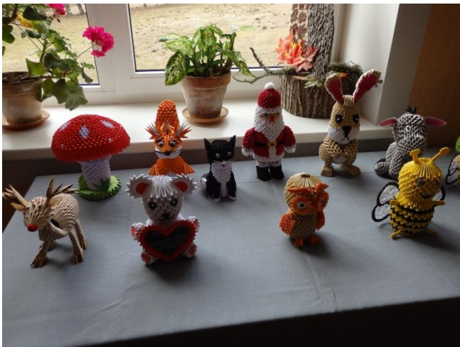
Izstāde “Papīra brīnums”