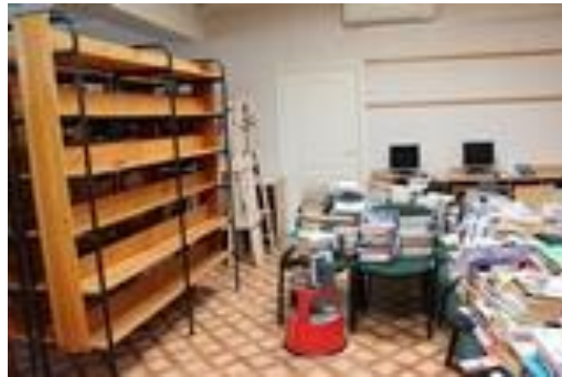
Plauktam 44 gadi, jāiet pensijā