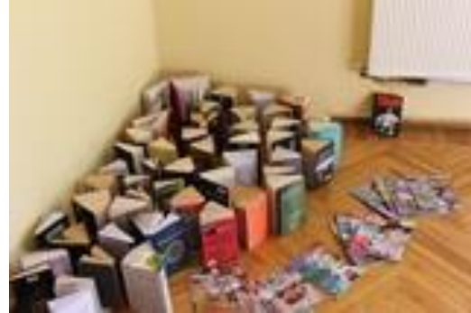
Pandēmijas laika karantīna grāmatām