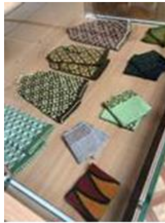
Pandēmijas laika Amatnieku centra darinājumi „Paliec mājās!”