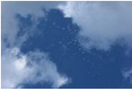
Jaunās lūkas pirmā lietus „kristības”