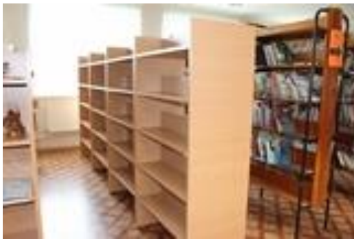
Jaunais plaukts gaida grāmatas