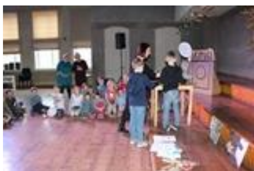
Druvas vidusskolas aktu zālē