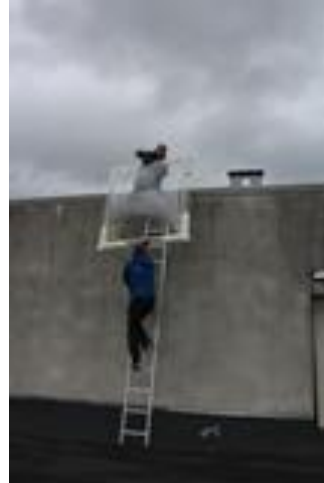
Jaunā lūka „kāpj” uz jumta