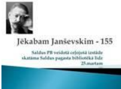
Novadniekam Jēkabam Janševskim 155