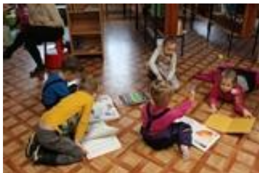
PII Graudiņš bibliotēkā