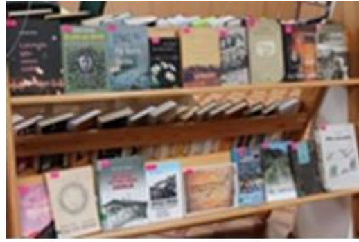
Svešumā : izvestie no Saldus rajona