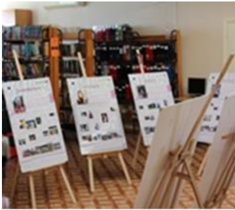
Mūsu novadnieki Latvijā un pasaulē „Kur sākas lidojums”