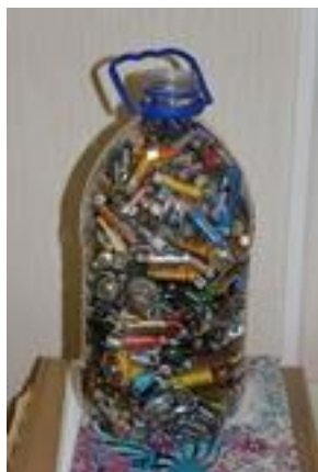
Izlietotās baterijas-Saudzēsim dabu!