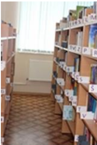
Jaunie daleņi jau vietā