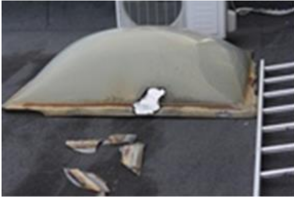
Vecā griestu lūka