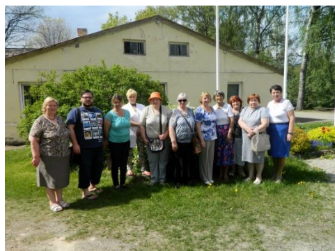
Rubas b-kas novadpētniecības materiāli Kursišu b-kā