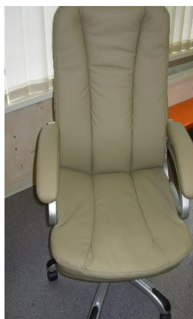
Bibl. vadītājam krēsls