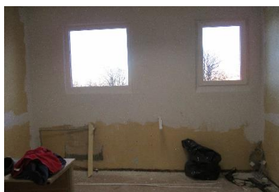
Datortelpa remonta laikā