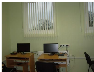
un pēc remonta