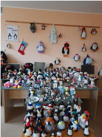
Kolekciju izstādes: Pingvīni, Vardes