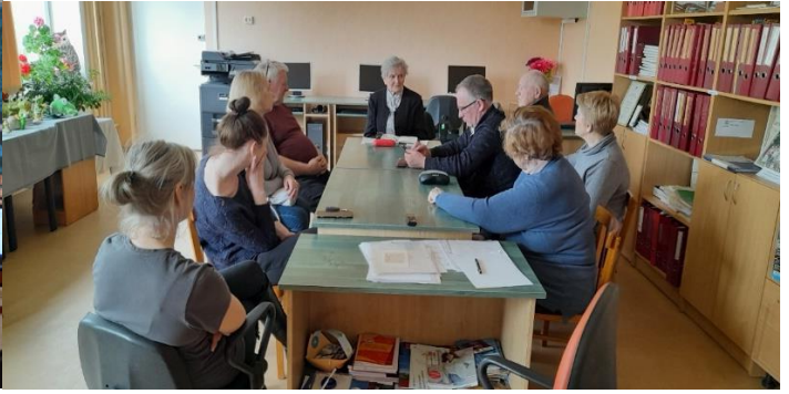
Pasākums “Atmiņu labirintos”