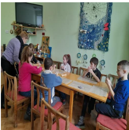
Radošā nodarbība “Veidojumi no māla”