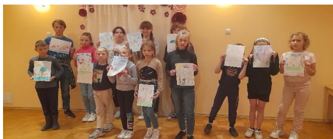
Pasākums”Jo lustīgs, jo kustīgs”