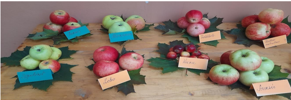
Izstāde “Ābolu uznāciens”