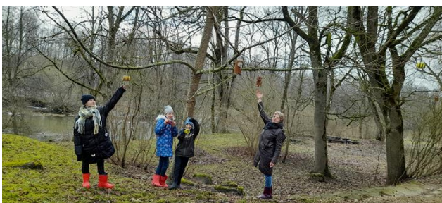
Radošā nodarbība iz kukaiņu dzīves