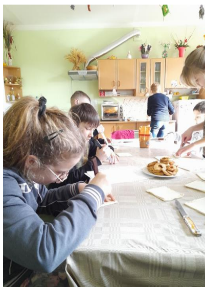
Radošā nodarbība “Virtuves sarunas”