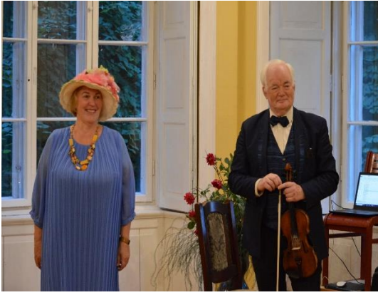
Dzejas diena “Saulīte plaukstā”