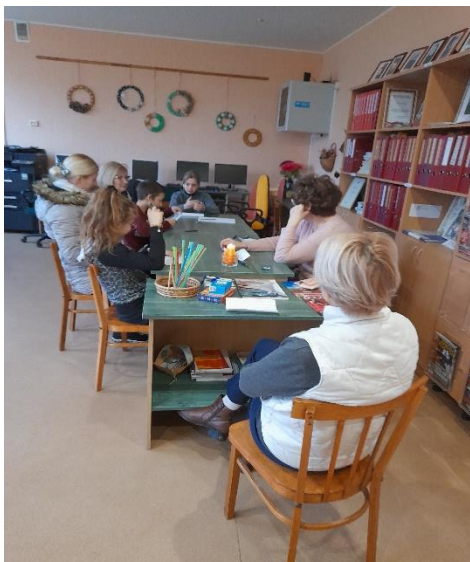
Pasākums “Mani izaicina lasīt prieks un radošums”