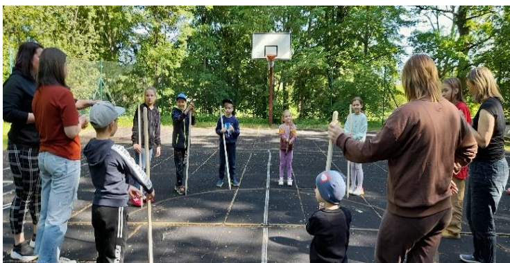
Saldus un Brocēnu jauniešu mājas mobilā izbraukuma spēles laukā