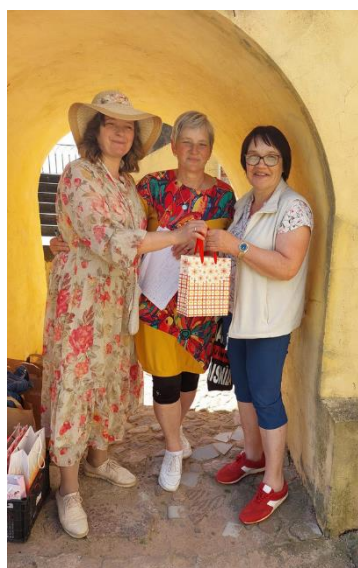
Literārās stafetes uzvarētājas saņem balvas