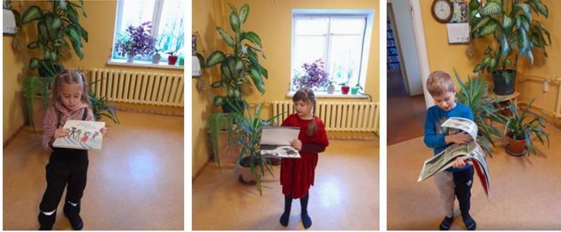
Bērnu žūrijas rezultātu apkopošanas pasākums bibliotēkā