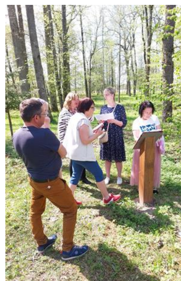
Pasākums Remteniekiem "Tiekamies Remtē"