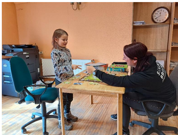
Tikšanās ar Saldus un Brocēnu jauniešu mājas darbinieci