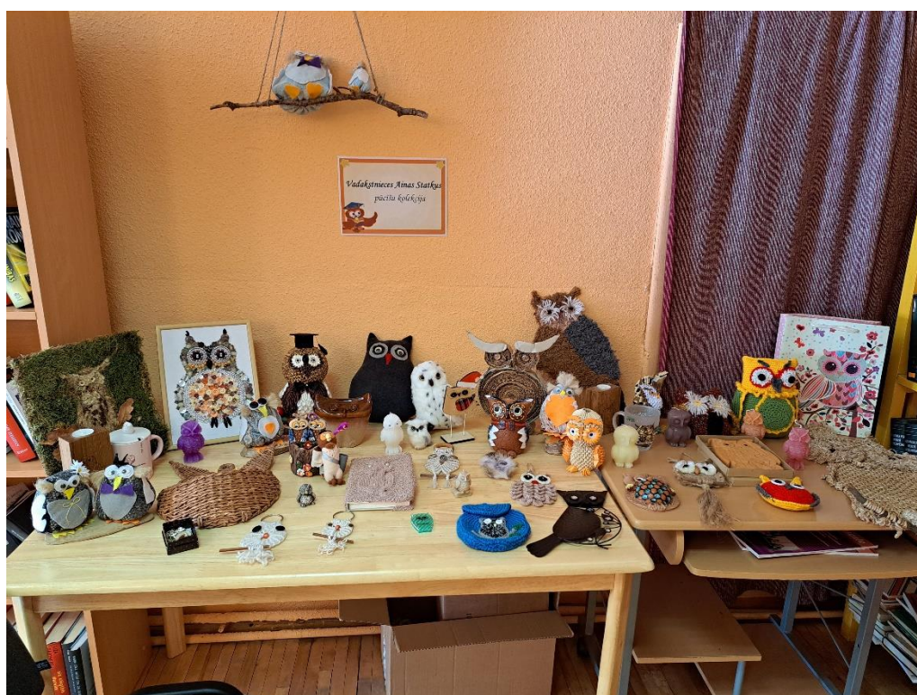
Vadakstnieces Ainas Statkus puču izstāde