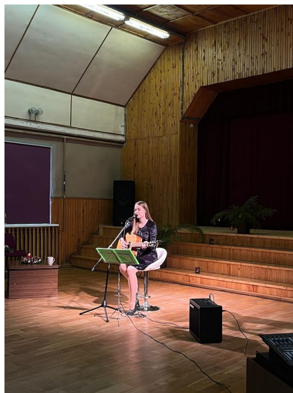
Pasākums Jaunaucēnu Tautas namā