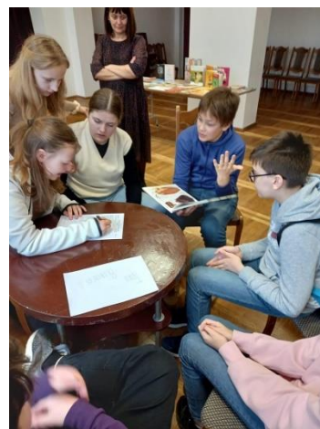
Attēlos – Brocēnu vidusskolas 6.a un 6.b klases skolēni izspēlē spēles “Baltā Vilka cirks” un “Medības pa enciklopēdijām”