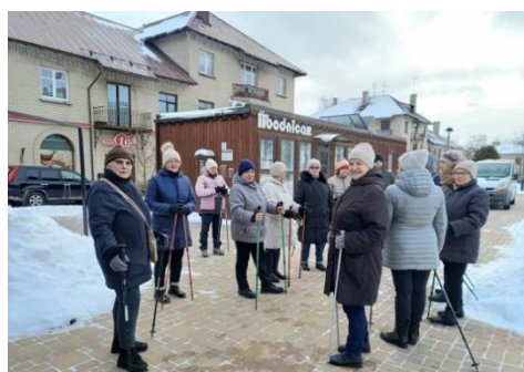
Attēlos - nodarbības zoom un nūjošana kopā ar fizioterapeiti veselības projekta ietvaros