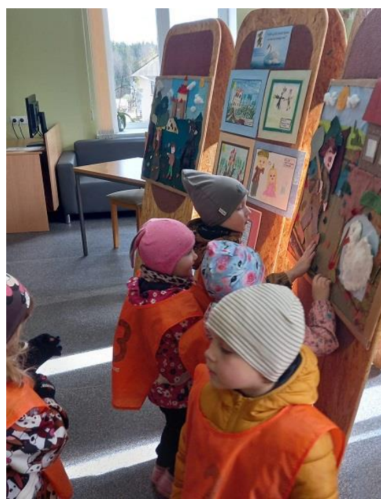
Attēlos - PII “Mūsmājas” BJC “Esmu mākslinieks” pulciņa audzētāju darbu izstādes