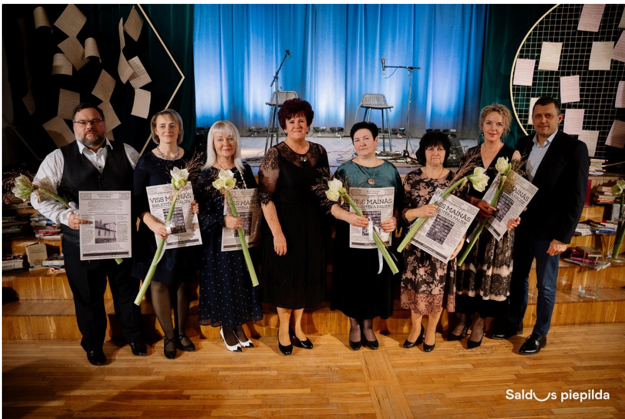
Decembrī Kultūras darbinieku svētkos saņēmu pateicību no Saldus novada pašvaldības par Ilggadēju, uzticīgu un atbildīgu darbu Saldus novada kultūras jomas stiprināšanā.