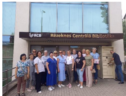
Saldus novada bibliotēkas darbinieki jūlijā devāmies profesionālās pilnveides un pieredzes apmaiņas braucienā uz Vidzemes un Latgales bibliotēkām (Jēkabpils novada Mežāres bibliotēku, Madonas novada Varakļānu bibliotēku, Rēzeknes centrālo bibliotēku, Ludzas novada bibliotēku)