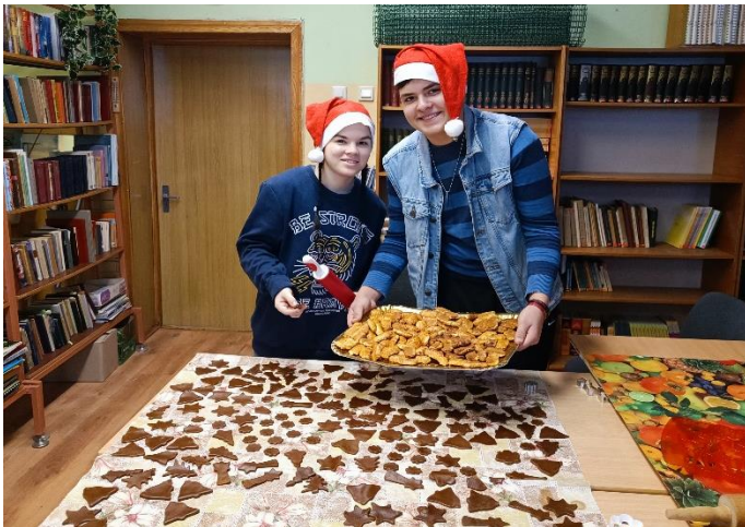
19. – 23.decembris Ziemassvētku rūku darbnīca