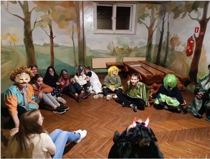
26.oktobris Spoku vakars bibliotēkā