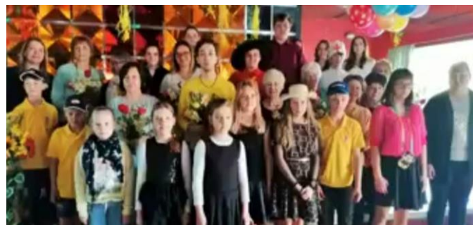
10.maijs Pulciņu noslēguma pasākums “Viss ir labs, kas labi beidzas”