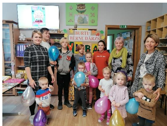
“Bērnudārzs bibliotēkā” /nodarbības 1 x mēnesī/