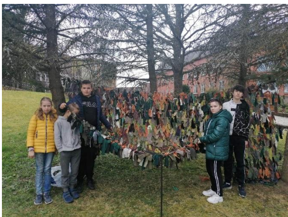
Pulciņu “Grāmatnieks” un “Uzzinis” aktivitātes /2x nedāļā – līdz 2022.gada maijam/