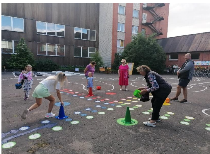
7.augusts “Krāsainais intelekts” Riču-raču un dambretes turnīri