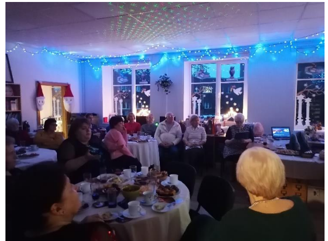
29.decembris “Starp Ziemassvētkiem un Jauno gadu”