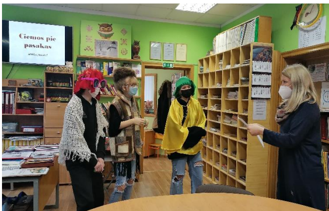
Pasaku nedēļas aktivitātes, atzīmējot 26.februāri – Pasaules pasaku stāstīšanas dienu