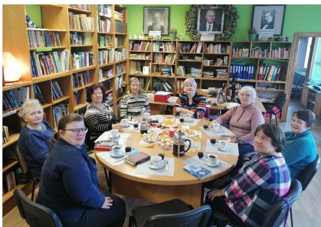
Grāmatu lasītāju klubs “Lubenieki” /tikšanās 1 x mēnesī/