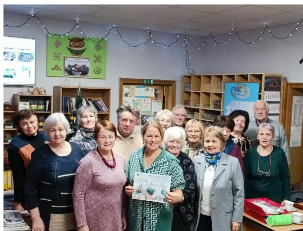
Ceļojumu stāstu klubs “Nāc kopā ceļot” /2022.gadā 5 nodarbības/