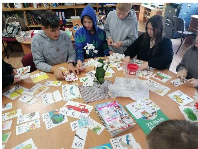
19. – 23.septembris Baltu literatūras nedēļas aktivitātes