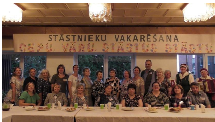
29. – 30.jūlijs Trešais Saldus novada Stāstu bibliotēku saiets “Stāstu stāstiem izstāstīju”