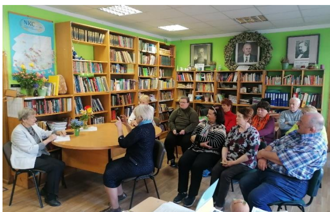
13.maijs “Māju stāsti”