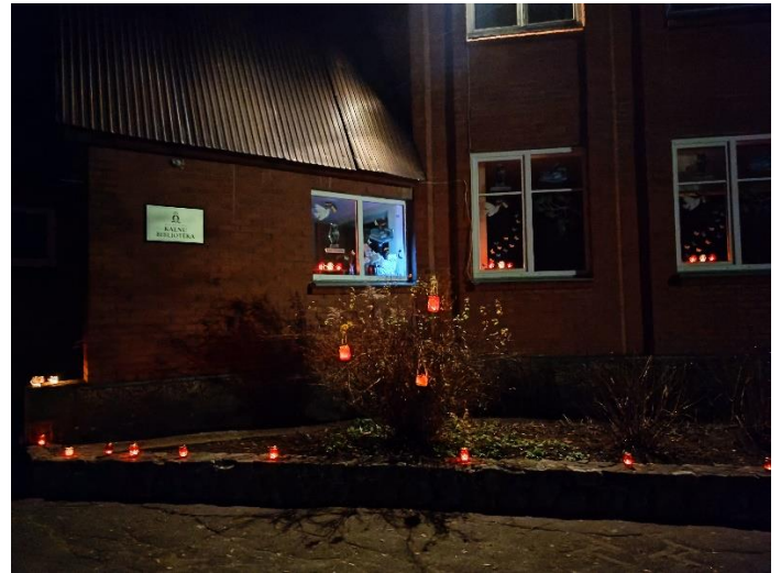
11.novembris Gaismas ceļš Lāčplēša dienā