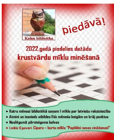
Krustvārdu mīklu konkurss par latviešu literatūru un rakstniekiem 1 x mēnesī