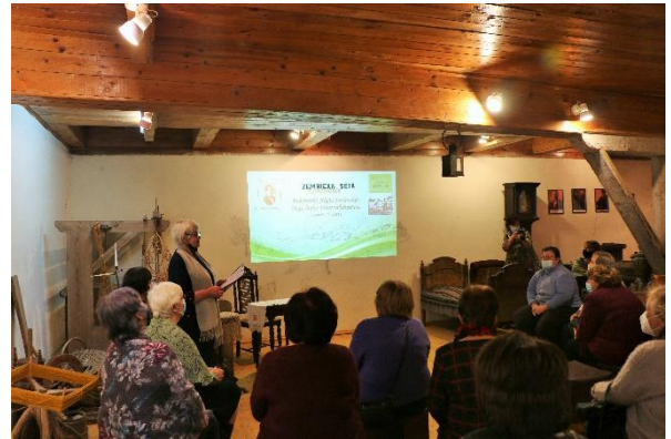
27.novembris Projekta noslēguma konference "Rakstnieks Jēkabs Janševskis-19.gadsimta lauku dzīves raksturotājs"