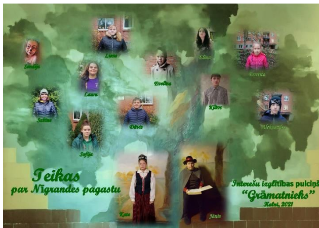
Novembris Bibliotēkas pulciņu bērnu ierunātas un nofilmētas teikas par Nīgrandes pagastu