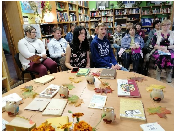
16.septembris Dzejas vakars "Dzeja dzīvo cauri laikiem"