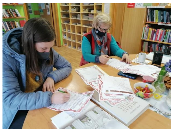
19. - 25.aprīlis

Pasaules stāstu stāstīšanās dienā pasākums tiešsaistē “Mans pandēmijas stāsts”