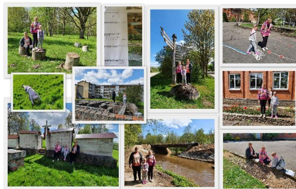
14. – 21.maijs

Fotoorientēšanās Kalnu ciematā “Toreiz un tagad”