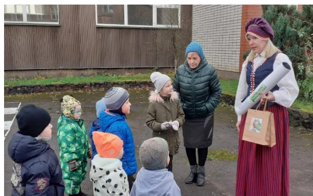
“Bērnodārzs bibliotēkā” /9 nodarbības, attālināti vai tiekoties ar bērniem laukumā pie bibliotēkas /