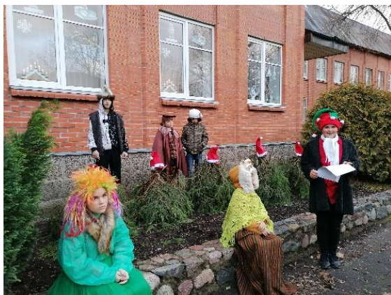
Pulciņu “Grāmatnieks” un “Uzzinis” aktivitātes /2 x nedēļā/