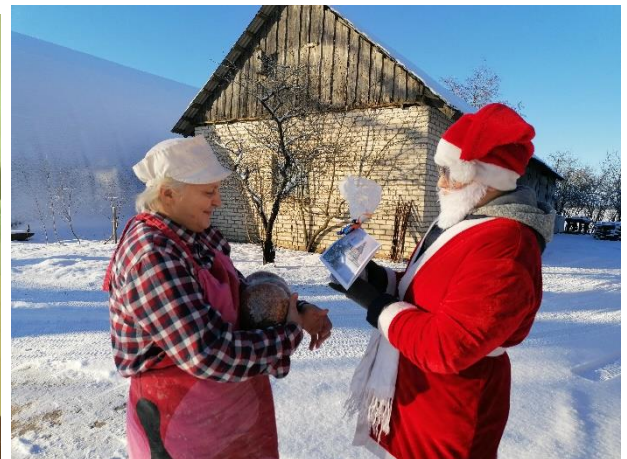
Decembris Tradicionāli lasītāju - jubilāru un senioru sveikšana gada nogalē