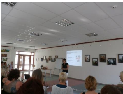
Kurzemes reģiona vasaras nometnē “ Dzīvesziņa jaunajai paaudzei”