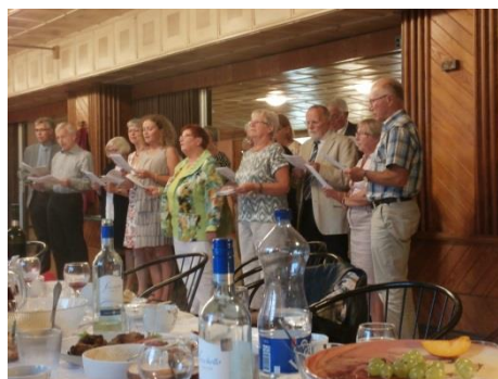
Sadarbībā ar Nīgrandes ev. lut. draudzi, tikšanās ar Karlsundes [Dānija] draudzes delegāciju