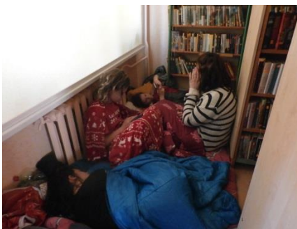
6.bibliotēkas nakts pasākumā