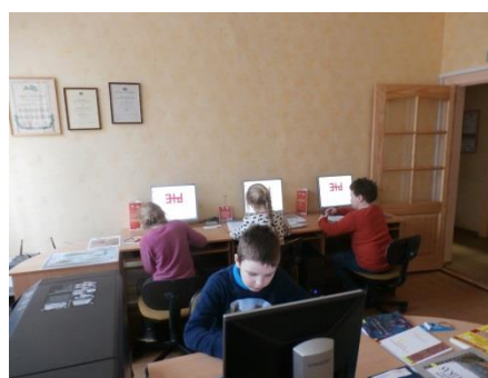
Bibliotēkārās stundas un Letonikas izmantošanas apguve