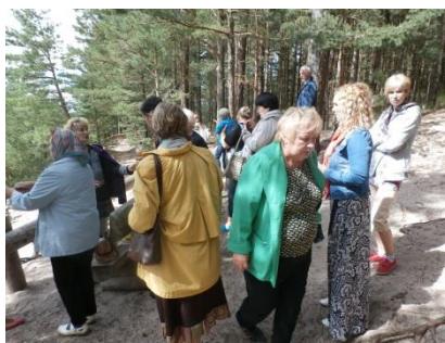
Sadarbība ar pensionāru padomi: pasākums Bunkā; ekskursija