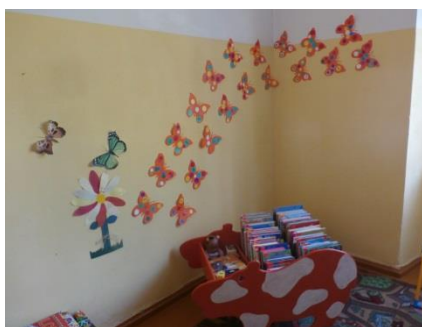
Izbraukuma seminārs Sēlijā