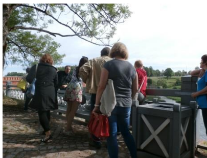
Pagasta darbinieku sadarbības pasākumā