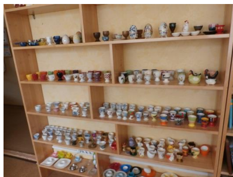
Izstādes no cikla “Mans vaļasprieks”