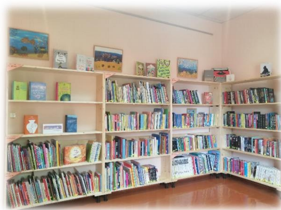
Tabula “Bibliotēkas iekārtas un aprīkojums”

2021. gadā bibliotēkā tika pilnībā mainīts plauktu un mēbeļu izkārtojums. Pēc iepriekšējā gadā veiktā remonta (WC ierīkošana) no jauna iekārtota bērnu literatūras telpa – uzbūvēti plaukti, nopirkts paklājs, sezonāli telpā tiek mainītas dekorācijas. Ir iekārtota mājīga un ērta lasītavas zona, jau iepriekš pārkrāsotie grāmatu plaukti pārbīdīti, tā lai telpā maksimāli ienāktu dienas gaisma. Lai arī kopumā bibliotēkas telpu stāvoklis ir apmierinošs, tuvākajā nākotnē būtu nepieciešams remonts krātuves telpai.