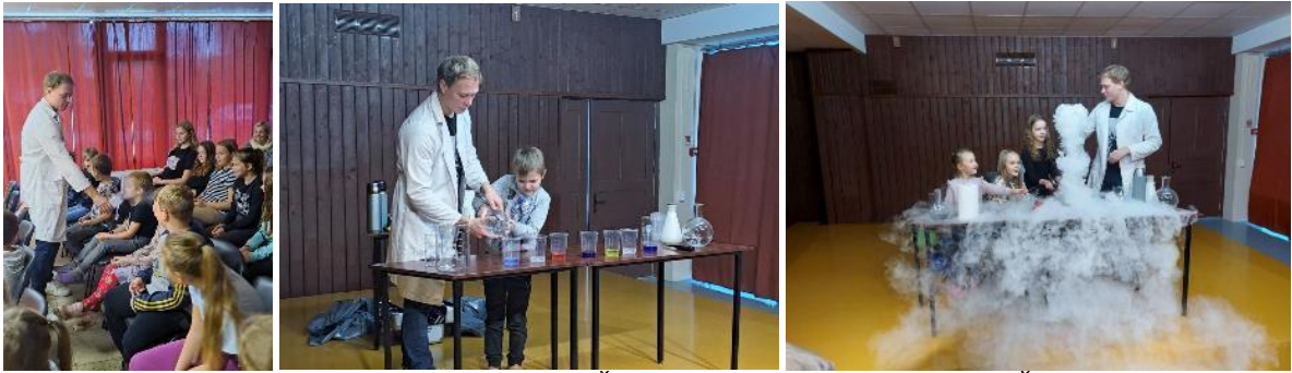
BRĪVLAIKA NEDEĻAS AKTIVITĀTES KURSĪŠOS bērniem un jauniešiem. ZINĀŠANU UN ERUDĪCIJAS DIENA, 25.10.2022.