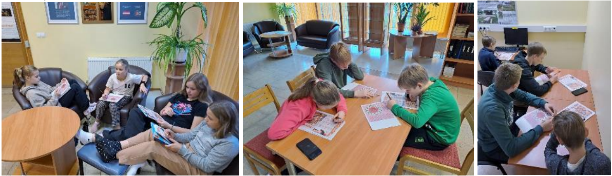
BRĪVLAIKA NEDEĻAS AKTIVITĀTES KURSĪŠOS bērniem un jauniešiem. GATAVOŠANAS UN NAKTS SVINĪBU DIENA, 27.10.2022.