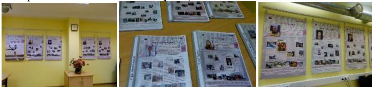
Foto izstāde "Saldus novads 2019", 14.09.-14.10.2020.