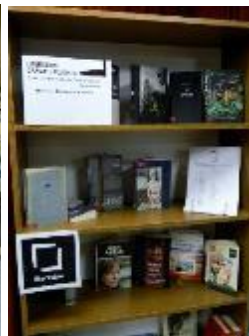
“Grāmatu andele” kopā ar tirgotāju “Virja LK”, 15.09.2020.