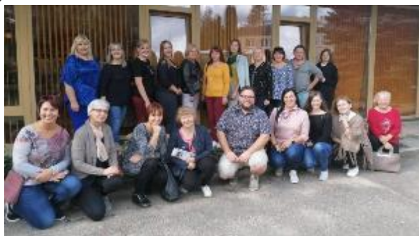
Kurzemes NVO centra Līderu akadēmijā Saldū, 30.09.-16.10.2020.