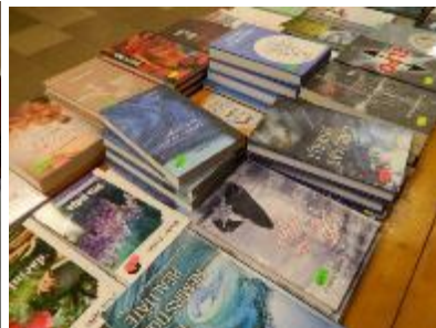
Krustvārdu mīklu risināšanas čempionāta 7.posma 1.kārta, 15.09.2020.