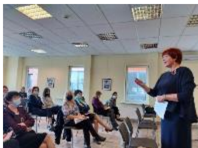
Saldus un Brocēnu bibliotekāru TIEŠSAISTES SEMINĀRS, 25.11.2020.