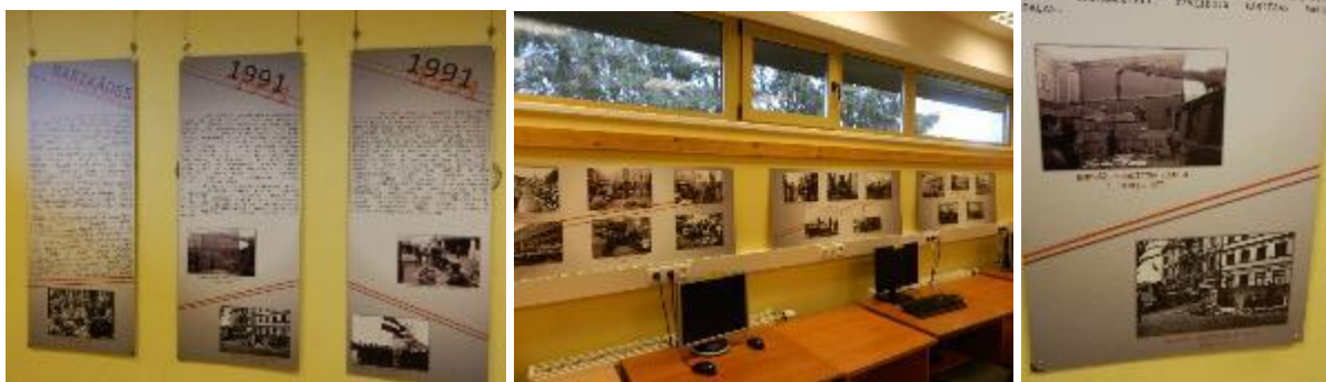
Foto izstāde "Mēs piepildām Saldu", 18.02.-18.03.2020.

J.Rozentāla Saldus vēstures un mākslas muzeja ceļojošā izstāde "1991.gada barikādes", no 9.01. līdz 9.02.2020.