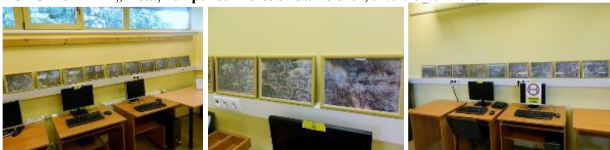
Novadpētniecības izstāde "Kur sākas lidojums", 07.08.-07.09.2020.