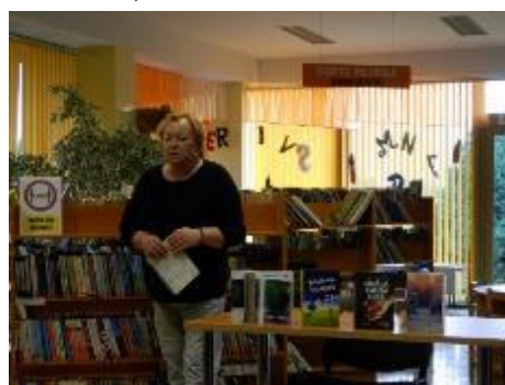
Pasākums “Cauri gadiem ar dziesmām un grāmatām”, 01.10.2020.