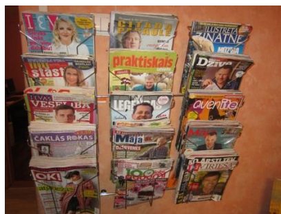
Jaunākās periodikas plaukts