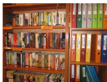
Jaunumu un dokumentu plaukts