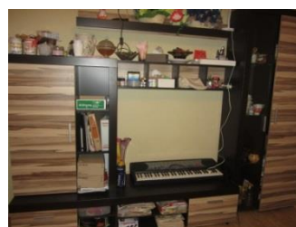
Sekcija radošo darbu materiāliem