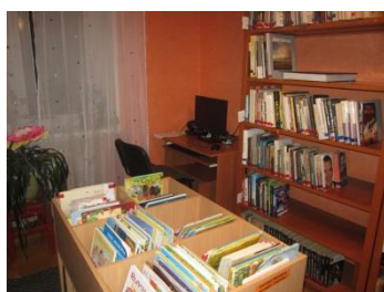
Nozaru literatūras telpa