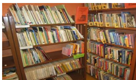
Bērnu literatūras stūrītis