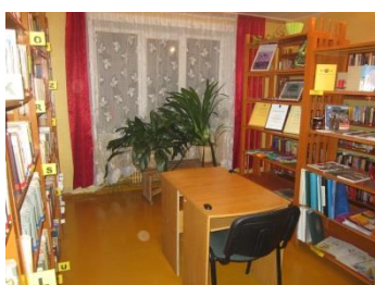
Dailliteratūras, novadpētniecības istaba