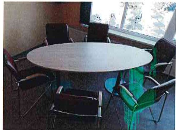
Grāmatu plaukti, galds un krēsli Jaunlutriņu pagasta bibliotēkas lasītavā

Jaunlutriņu bibliotēkas struktūrvienībā Ošenieki pārskata periodā ir iegādāti jauns žurnālu plaukts ar nodalījumiem, grāmatu plaukts, atpūtas telpā jauns dīvāns un galds, sagādāti materiāli bērnu istabas grīdas remontam, tualetes un koridora remontam. Remontdarbi bērnu istabā tiks pabeigti 2020.gadā.