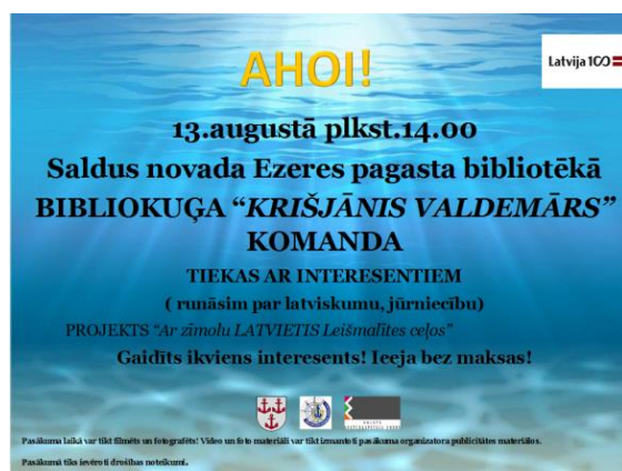
13.08.2020 Bibliokuģa „Krišjānis Valdemārs” komandas tikšanās