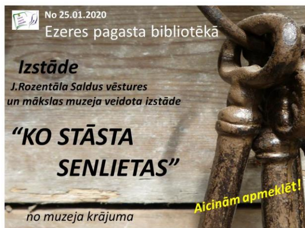
2020.gada janvārī Jaņa Rozentāla Saldus vēstures un mākslas muzeja veidotā izstāde "Ko stāsta senlietas"