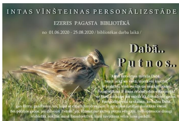
Zvārdenieces Intas Vīnšteinas fotoizstāde vasarā