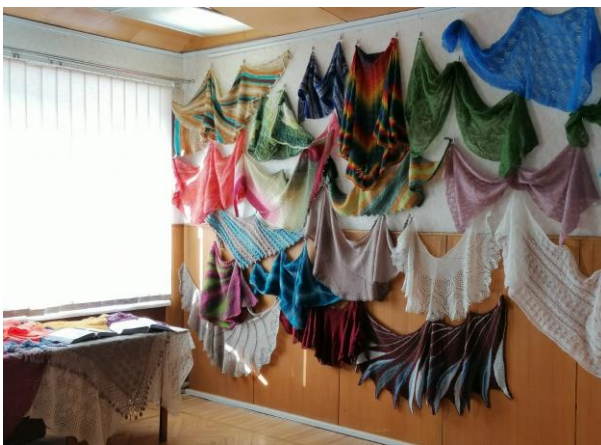
Brocēnu lietišķās mākslas pulciņa "Madaras" rokdarbu izstāde