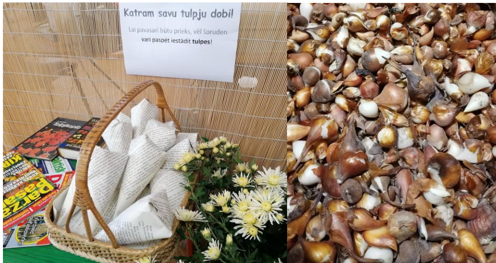
Tulpu audzēšanas materiāli