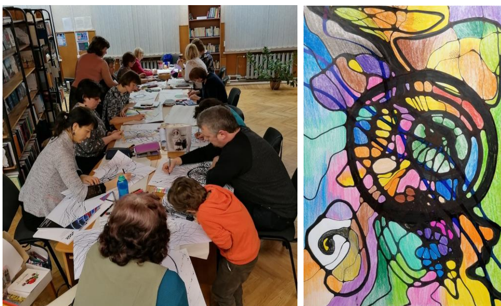
Neurografikas nodarbība un rezultāts

Pirmie zaļumi uz palodzes; Neurografika – es un manas ieceres/emocijas; Neurografika – manas dzimtas koka spēks.