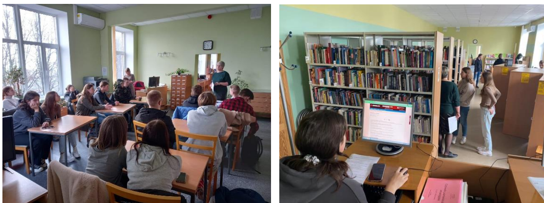
Attēlos – ZPD stundas ietvaros Brocēnu vidusskolas 8.a klase apmeklē bibliotēku