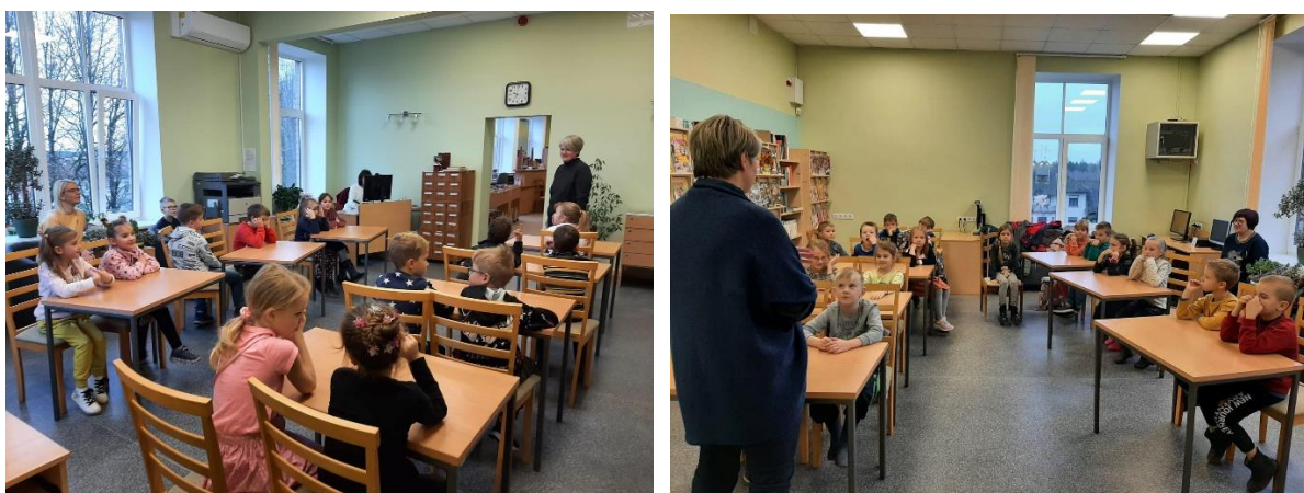
Attēlos – Brocēnu vidusskolas 1.a un 1.b klase iepazīstas ar Brocēnu bibliotēku