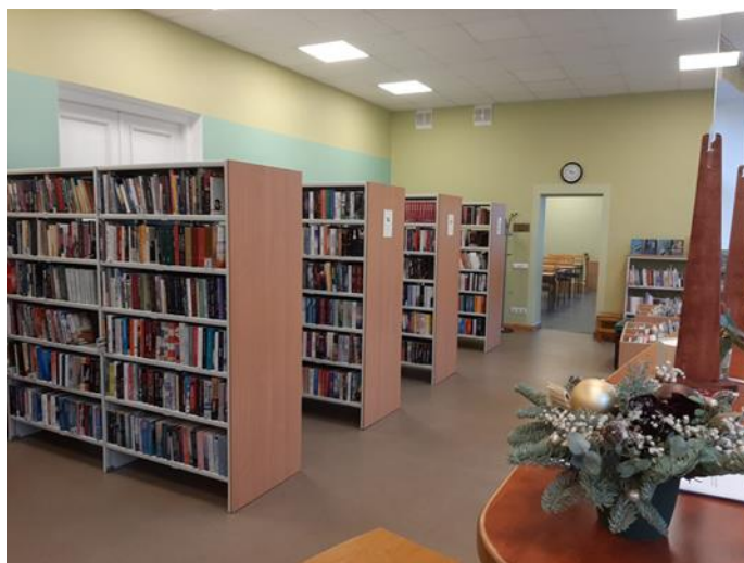
Jaunie plaukti abonementā

Materiālā un tehniskā stāvokļa vērtējums apmierinošs, ir finansējums grāmatām un žurnāliem. Nopirkts dators un 4 plaukti abonementa veco plauktu nomainīai. Nepieciešami plaukti novadpētniecības materiāliem.