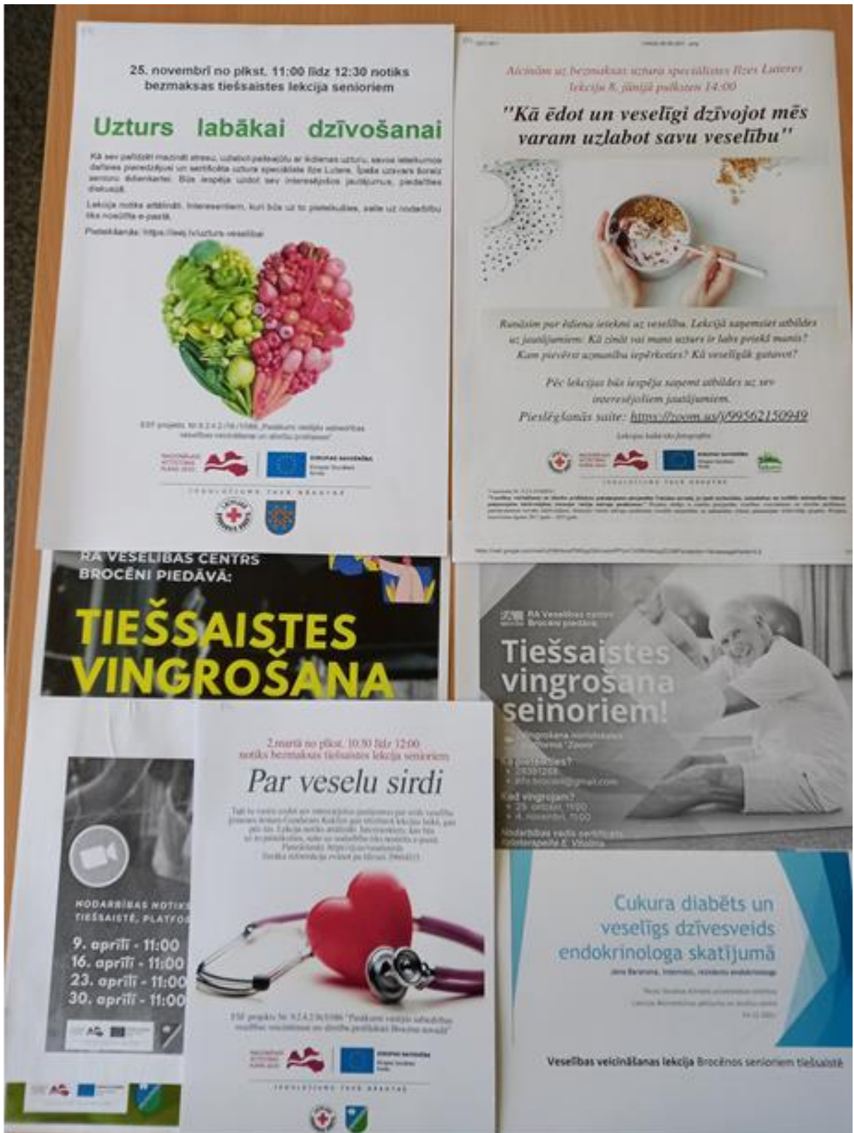
Attēlā - ieskats bibliotēkas organizēto aktivitāšu afišās - veselības veicināšanas projektā