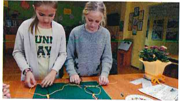
Radošā nodarbība "Maciņš telefonam un naudiņai"