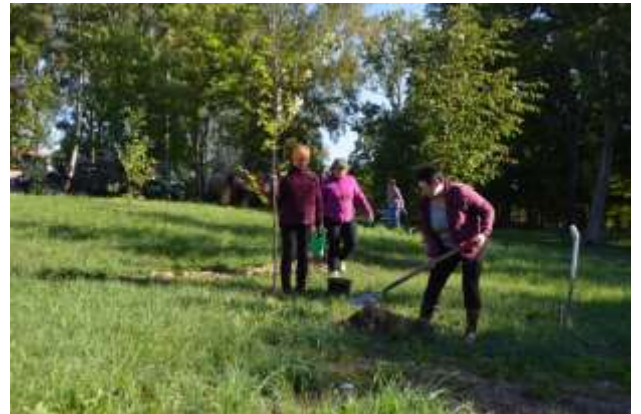
Latvijai-100 koku stādīšana