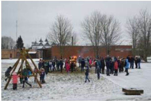
Barikāžu atceres dienā