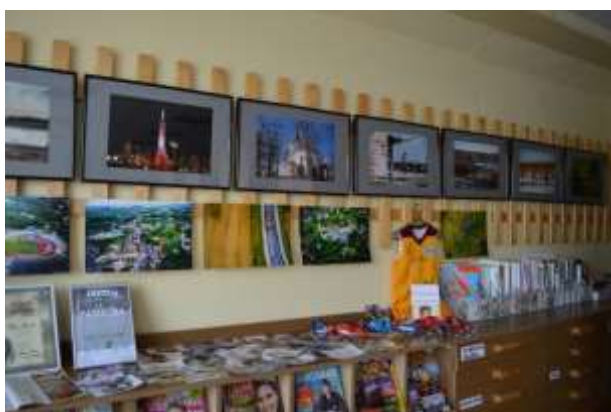
Jāņa Rinča foto un Ivetas Gulbes Floristikas izstāde