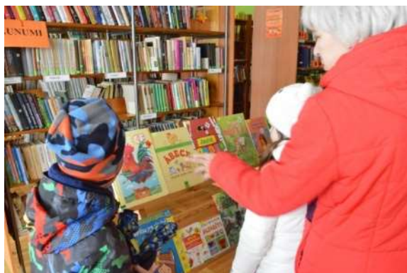
Ābeču izstāde "Burti burto visu laiku"