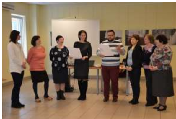
Radošās domāšanas kurss