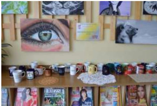
Ievas Brices krūzīšu izstāde