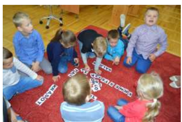
Bibliotekārā stunda 1. klasei Saliekam vārdus, ko var darīt bibliotēkā