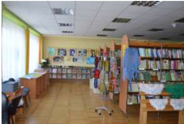
Rokdarbu izstāde "Garajos ziemas vakaros"