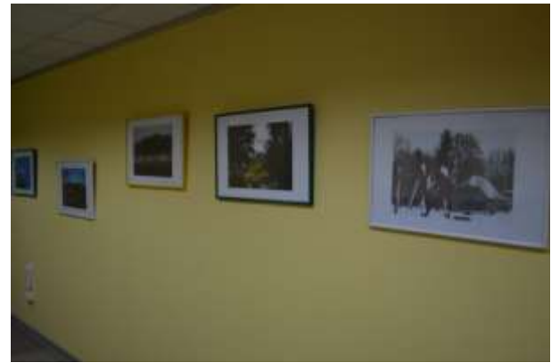
Silvas Brices foto izstāde