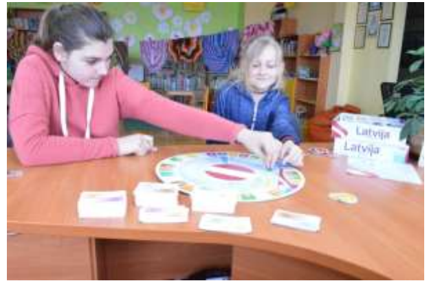
Spēļu pēcpusdiena – iepazīstam jaunās spēles