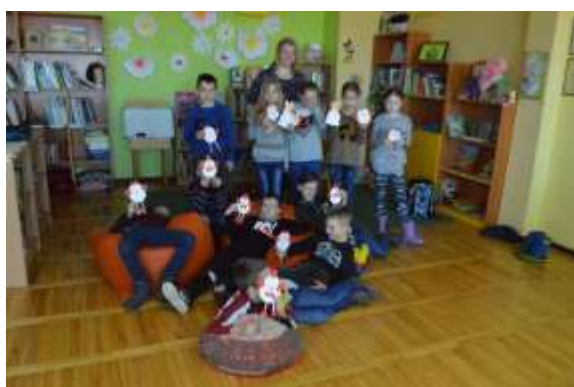
Diena ar 3. klasi