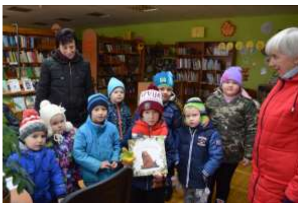
PII "Vālodzīte" audzēkņi atnākuši uz bibliotēku pēc jaunas grāmatas