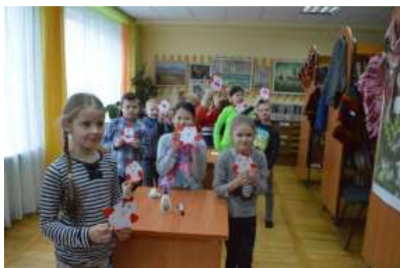
Diena ar 1. klasi