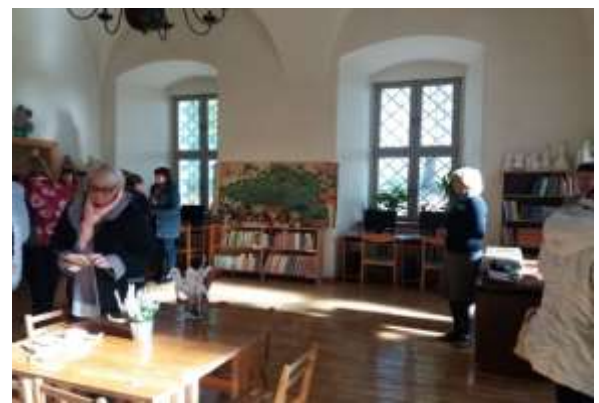
Pieredzes apmaiņas izbrauciens uz Lietuvas bibliotēkām