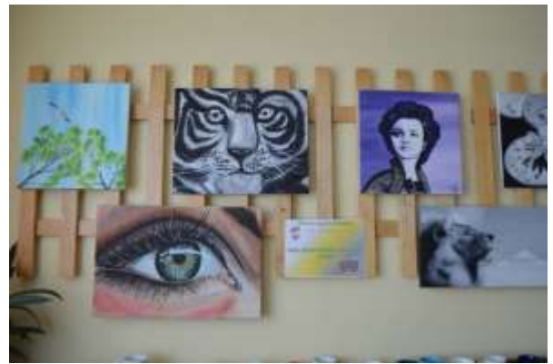
Blīdenieces Kristas Bergas gleznas