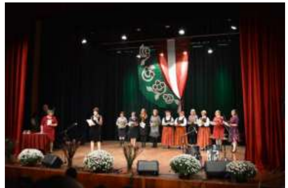
Pateicību pasniegšana Latvijas 100gades koncertā