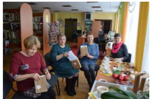
Ziemassvētku pasākums Bibliotēkas labdariem