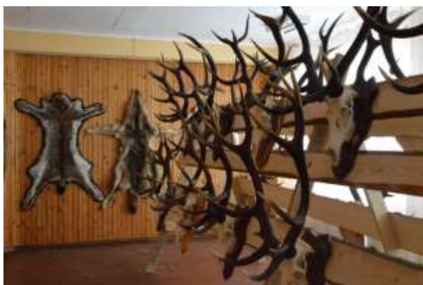
Medību trofeju izstāde