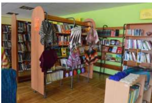
Plecu lakatu izstāde