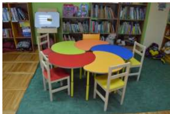
Bērnu stūrītīm jaunie galdi un krēsli