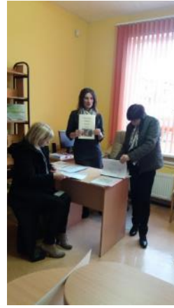
Pieredzes brauciens pa novada bibliotēkām