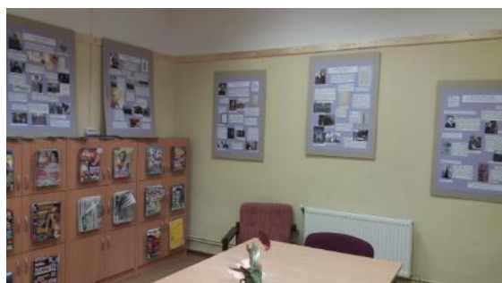
“ Saldus vēstures pētnieki”