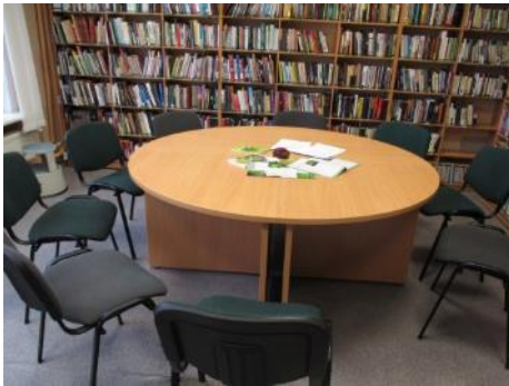
Pielikums Nr. 1