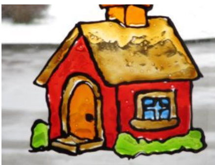
Pielikums Nr. 5