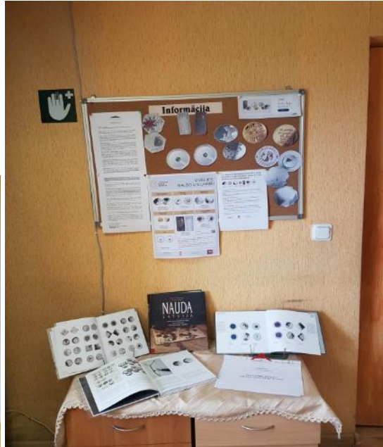
Bērnu darba izstāde