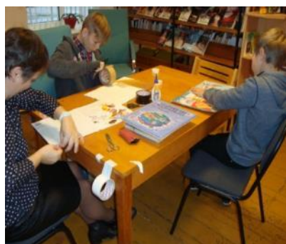
Labo darbu nedēļa