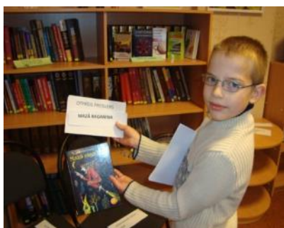
Veļas diena bibliotēkā